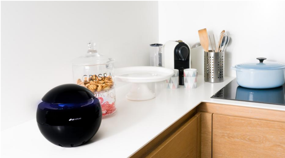
Purificateur BULDAIR, 59,90€