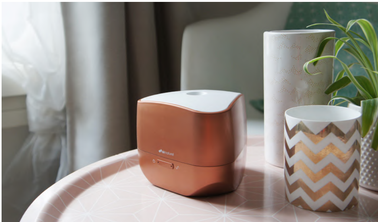
Diffuseur d'huiles essentielles AIROM, 59,90€

Air Naturel, bien implantée sur le marché national vise un nouvel objectif : répondre à une demande au-delà des frontières françaises. Partout dans le monde, l'impact de la pollution de l'air sur la santé est devenu une problématique cruciale. L'actualité internationale conduit chacun d'entre nous à se questionner sur la qualité de l'air intérieur et extérieur que nous respirons. La demande de produits innovants est donc aujourd'hui considérable. Air Naturel se devait de partager son expertise au plus grand nombre.